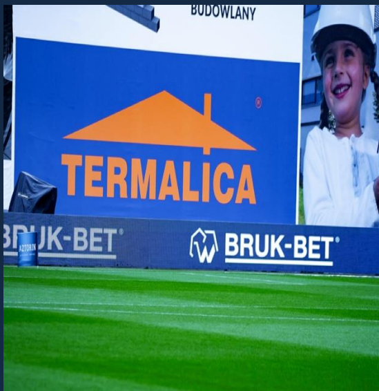
Reklama na bandach LED i bandach statycznych